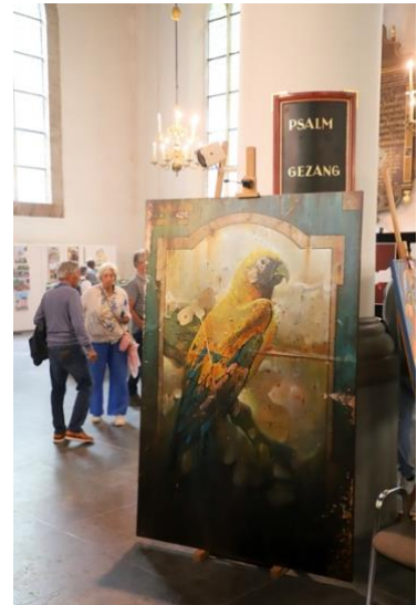
(Een kijkje op de art fair in de grote kerk)

Met het oog op de toekomstige verbouwing van de kerk (renovatie/herbestemming tot bibliotheek) was deze editie waarschijnlijk de laatste keer dat de volledige binnenruimte beschikbaar was voor de art fair. Dit gaf een bijzondere lading aan deze editie en benadrukte de unieke rol die de kerk tot nu toe vervulde als centrale kunstlocatie.