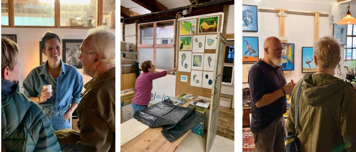
(Aansluiting deelnemers O.O.A.K. company aan de Wilheminahaven zuidzijde aan de kunstroutes)

In samenwerking met Vlaardingen Partners en The Profs is de marketingcampagne breder uitgezet dan in eerdere edities. Deze inspanningen droegen bij aan het aantrekken van een groter en regionaal georiënteerd publiek.