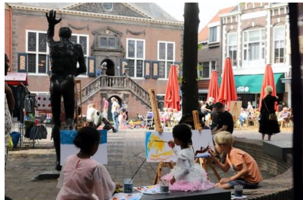
(Bloemtaartjes met Moois van Mooy en een workshop plein-air schilderen met de jeugd)