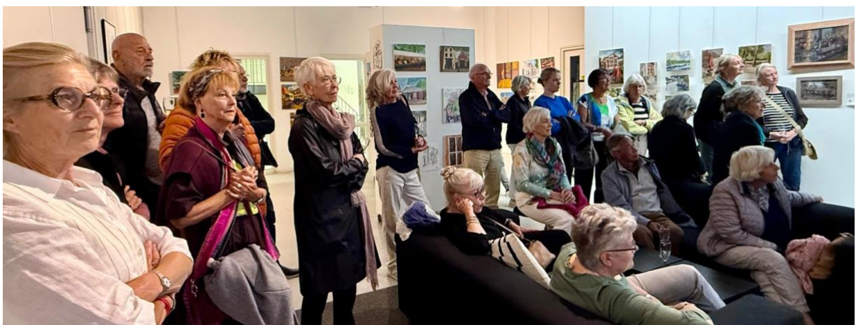
(De opening op 12 september in Kade40)

Op dinsdag 8 september verhuisden de werken naar Kade40, waar op vrijdag 12 september de officiële opening van de overzichtstentoonstelling plaatsvond. Tijdens deze feestelijke