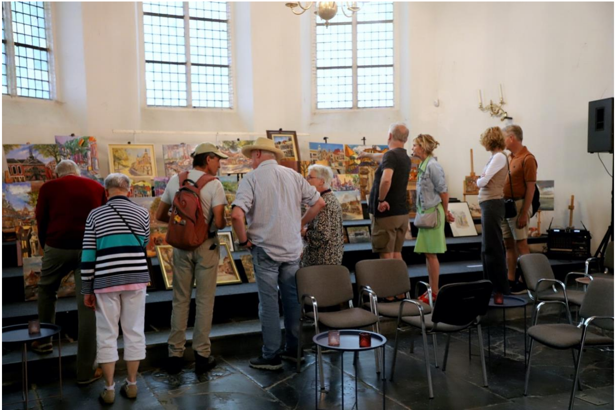
(De verzameling schilderijen in het koor van de kerk groeide naarmate de verstreek)

maar ook voor het publiek. De gemaakte werken werden die dag bijgeplaatst in het koor van de kerk tijdens de art fair. Daarna verhuisde de complete collectie naar Kade40 voor een overzichtstentoonstelling.