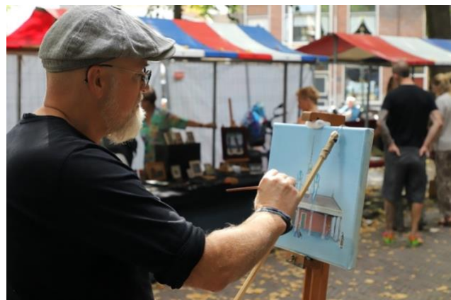
(Schilders al vroeg aan de Markt om zijn werk klaar te krijgen voor de tentoonstelling)