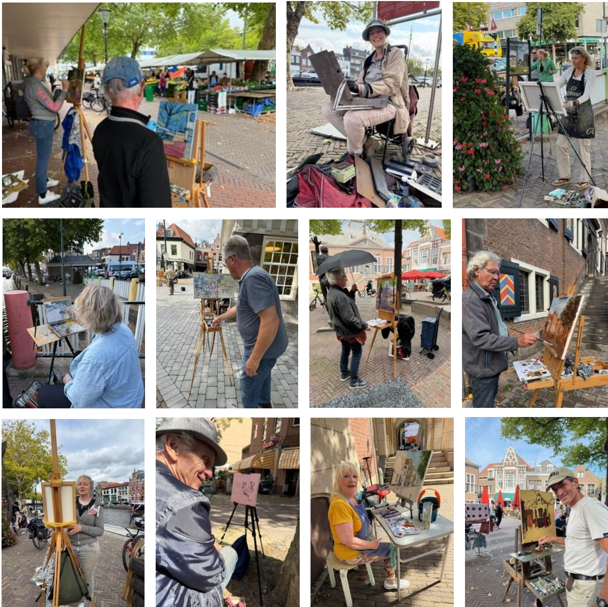
(Een aantal van de kunstschilders aan het werk in de stad)

Deze schilders verbleven tijdens hun deelname in het Deltahotel aan de Maas, een locatie die bijdroeg aan een gastvrije en inspirerende sfeer. Na de werkdagen werd samen gegeten en met elkaar gesproken om de onderlinge band aan te halen, zoals zij gewend zijn bij dergelijke evenementen. De aanwezigheid van deze kunstenaars in de stad zorgde voor veel interactie met voorbijgangers, bewoners en amateurdeelnemers. De open manier van werken in de openbare ruimte trok veel bekijks en maakte het project bijzonder zichtbaar en levendig.