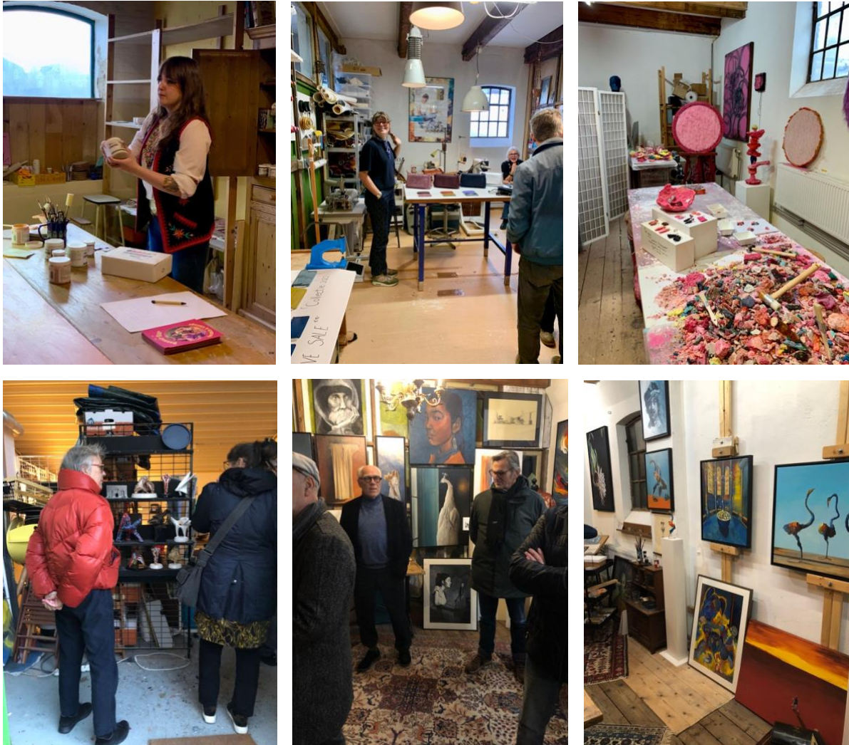
(Een greep uit de ateliers die mee hebben gedaan aan het Open Atelier weekend)