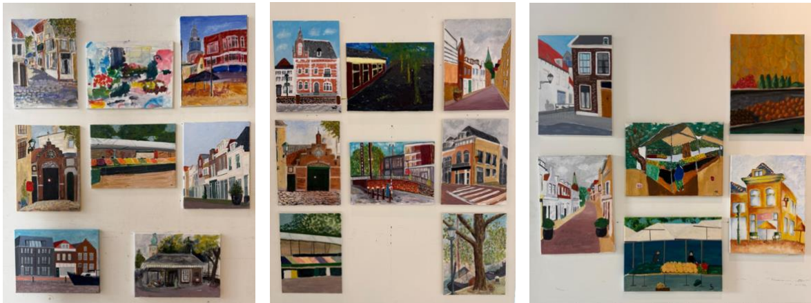
(Een greep uit de inzameling van de beginners tijdens de expositie in Kade40)